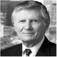
Text von David Wilkerson

„Und die Apostel sprachen zu dem Herrn: Mehre uns den Glauben! “ (Lukas 17,5) Die Männer, die zum engsten Kreis Christi gehörten, baten ihren Herrn um etwas sehr Wichtiges. Sie wollten die Bedeutung und die Auswirkungen des Glaubens umfassender verstehen. Sie sagten damit im Wesentlichen: „Herr, welche Art von Glauben wünschst du von uns? Gib uns eine Offenbarung über die Art von Glauben, der dir gefällt. Wir wollen den Glauben in seiner vollsten Bedeutung erfassen.“